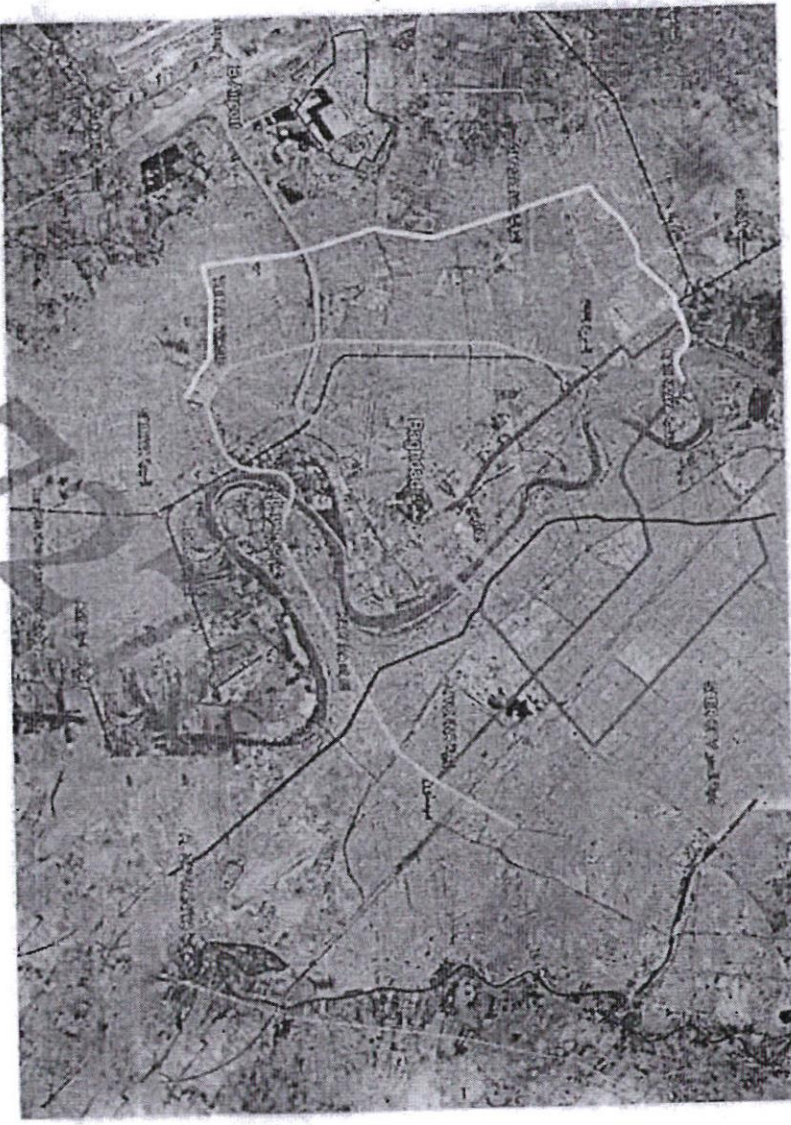
المسارات المقترحة لمترو بغداد